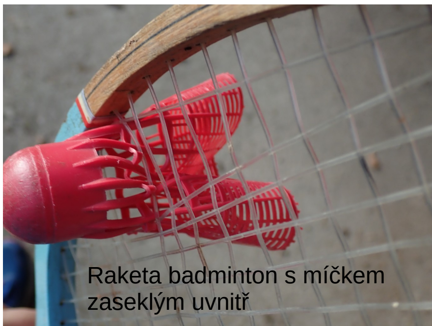
Raketa badminton s míčkem zaseklým uvnitř