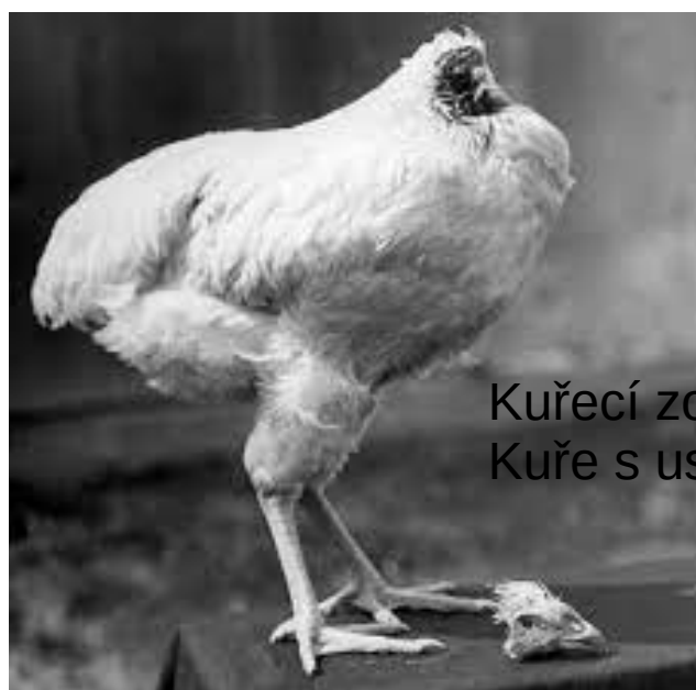
Kuřecí zombí Kuře s useknutou hlavou !ŽIJE!

Slapský Obdobník žádá o příspěvky! Pokud chcete některý ze svých nápadů uveřejnit, pošlete je na e-mail našeho redaktora: j.kittler.ml@centrum.cz