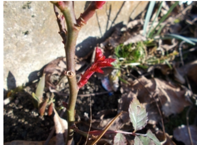
Růže ( keříčková )