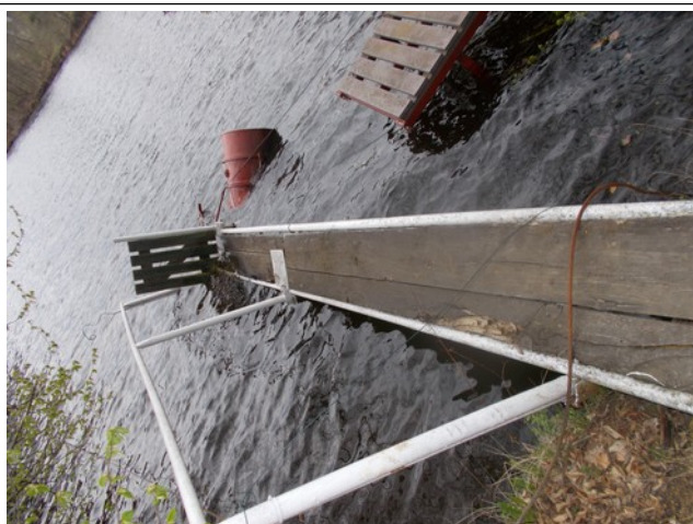
Molo je nakřivo asi pod 40 stupni